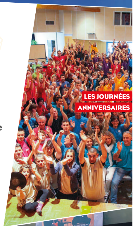
LES JOURNÉES ANNIVERSAIRES