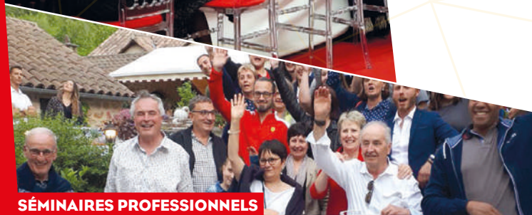
SÉMINAIRES PROFESSIONNELS ET TEAM BUILDING